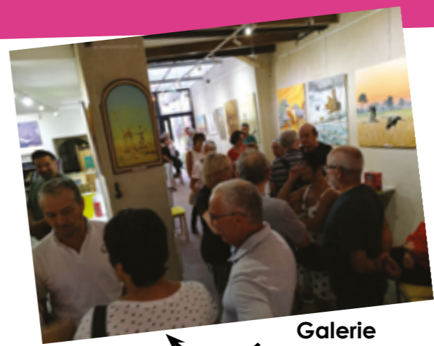
Galerie Marcel Fabre