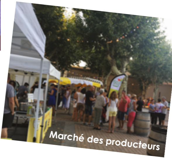
Marché des producteurs