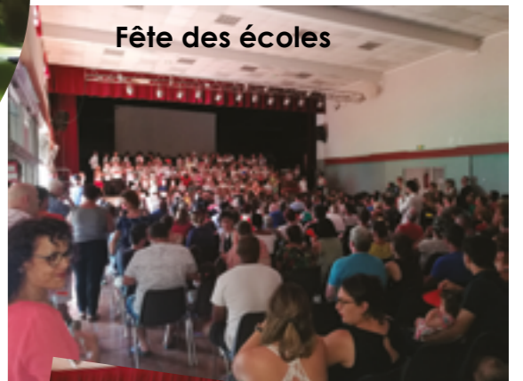
Fête des écoles