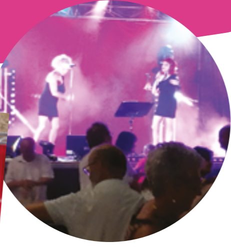
Fêtes du 14 juillet