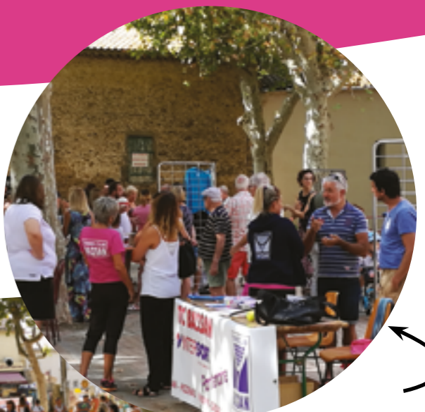
Matinée des associations