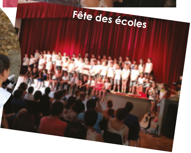
Fête des écoles